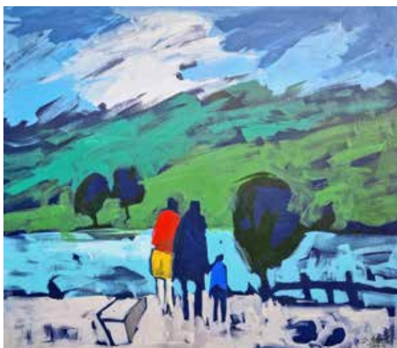
Dušan Sterle (brez naslova) dim. 80 x 70 cm cena: 300 evr