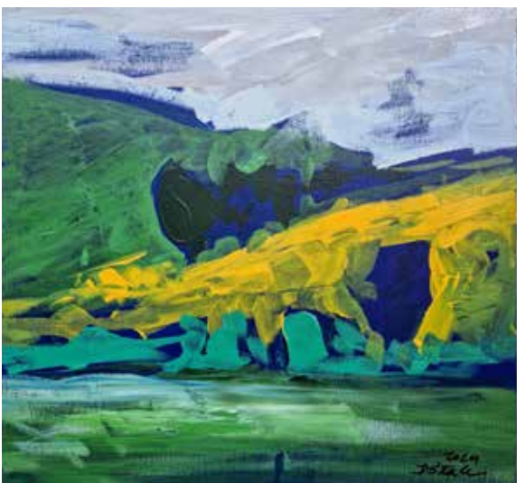
Dušan Sterle (brez naslova) dim. 36 x 33,5 cm cena: 150 evr