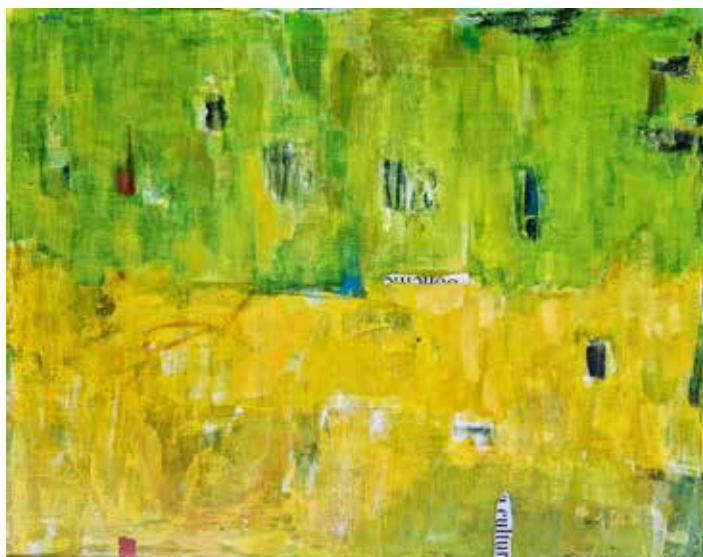
Jožica Medle VERDE QUE TE QUIERO VERDE dim. 40 x 50 cm cena: 400 evr