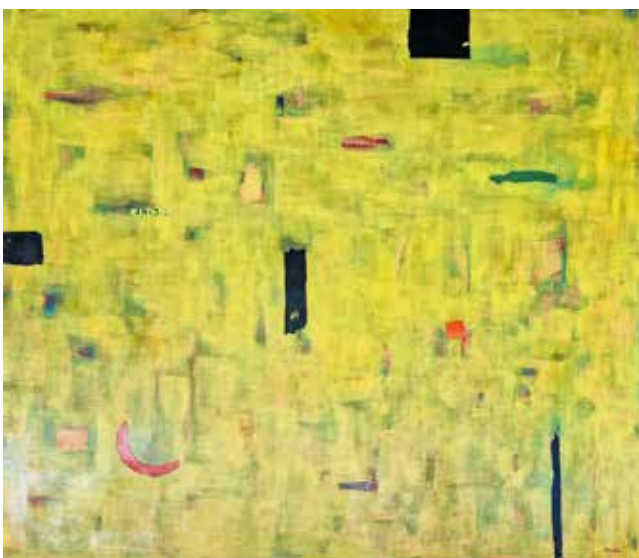
Jožica Medle PELIN ALI ARTEMISIA dim. 70 x 80 cm cena: 700 evr