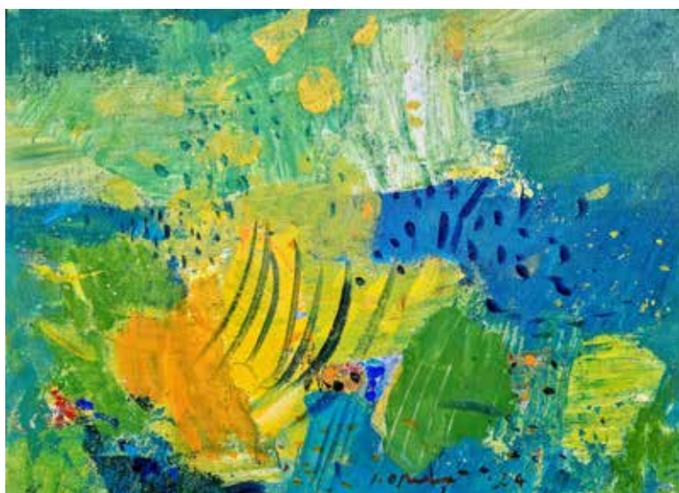
Janko Orač PRIDIH POMLADI OB JEZERU