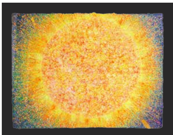
Darko Slavec POLETNO SONCE dim. 66 x 82,5 cm cena: 700 evr