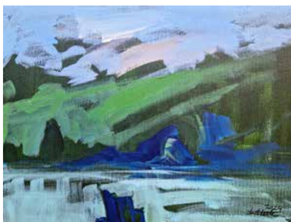
Dušan Sterle (brez naslova) dim. 40 x 30 cm cena: 150 evr