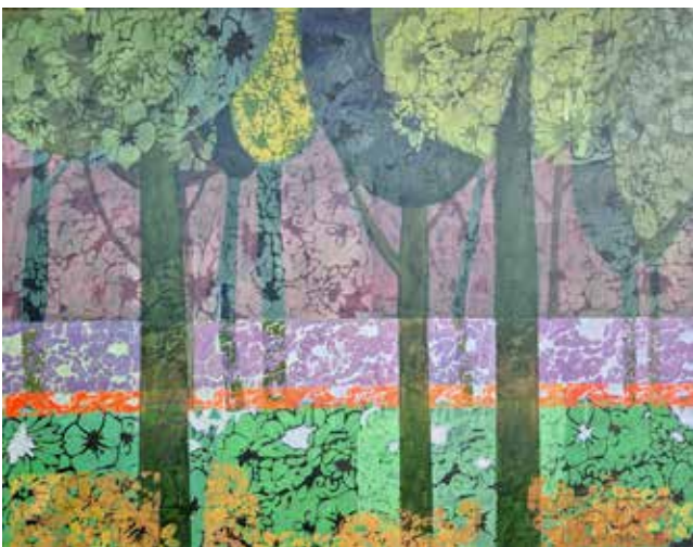
Marija Mojca Vilar Vrt spoznanja dim. 90 x 70 cm cena: 500 evr