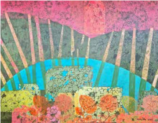
Marija Mojca Vilar Globina doživetega dim. 90 x 70 cm cena: 500 evr