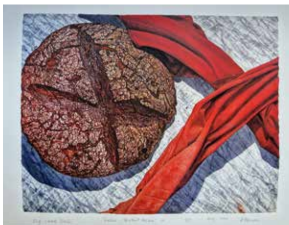
Darko Slavec Iz cikla PORTRET HLEBCA dim. 85 x 69 cm cena: 700 evr