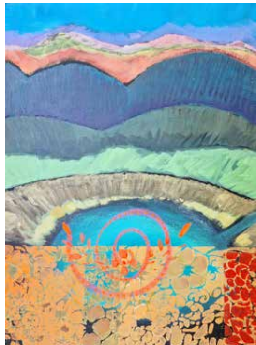
Marija Mojca Vilar - dim. 30 x 40 cm cena: 300 evr