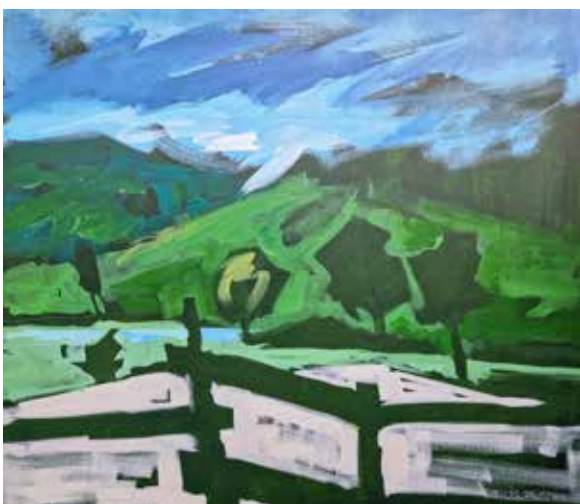
Dušan Sterle (brez naslova) dim. 80 x 70 cm cena: 300 evr