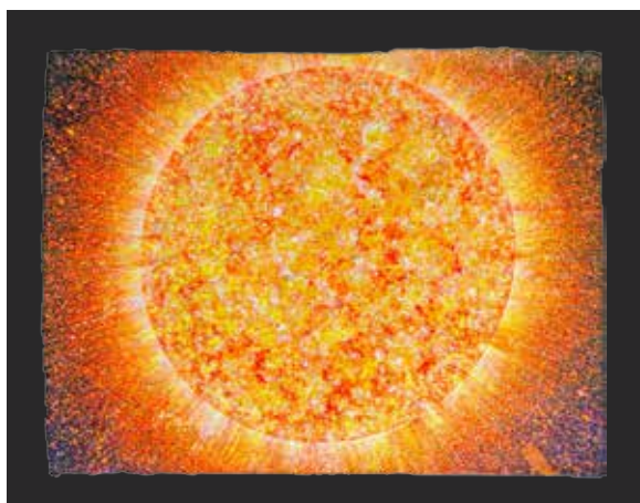
Darko Slavec POLETNO SONCE dim. 66 x 82,5 cm cena: 700 evr